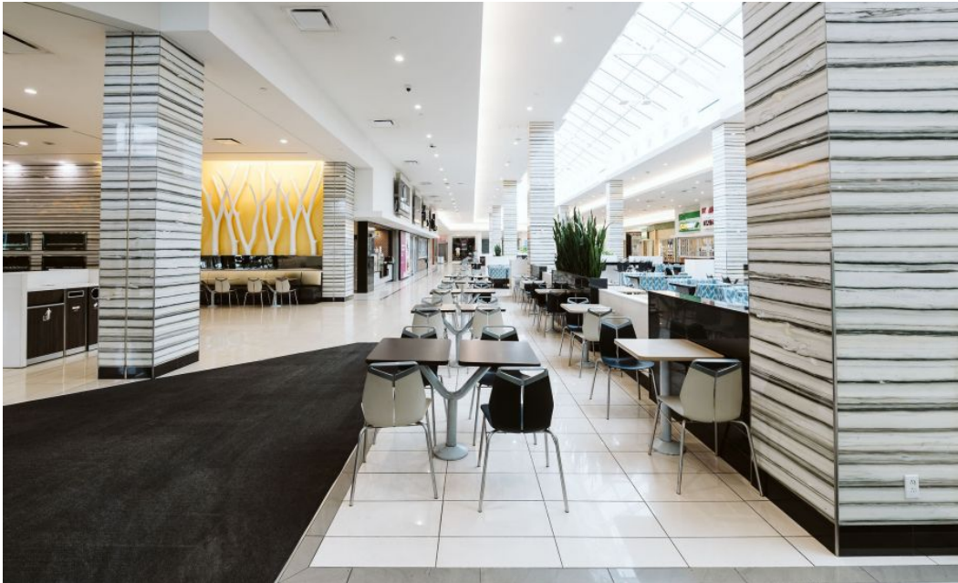
Aire de restauration

2151-2153, boulevard Lapinière, Brossard, QC