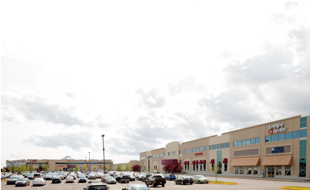
PHOTO DE L'IMMEUBLE