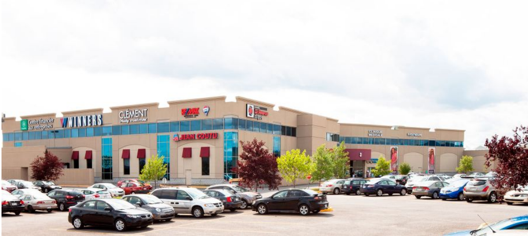
PHOTO DE L'IMMEUBLE