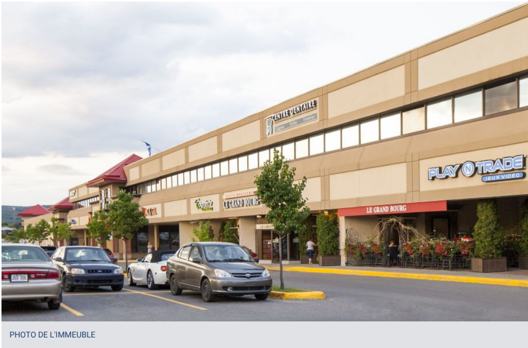
PHOTO DE L'IMMEUBLE