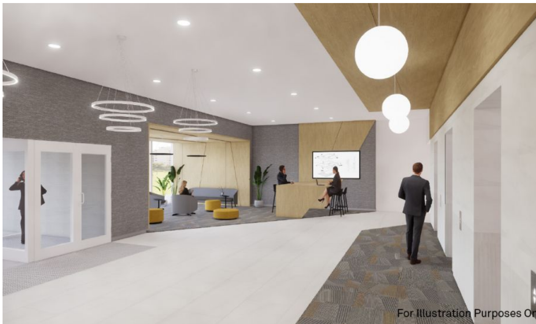
Aux fins d'illustration seulement - esquisse entré