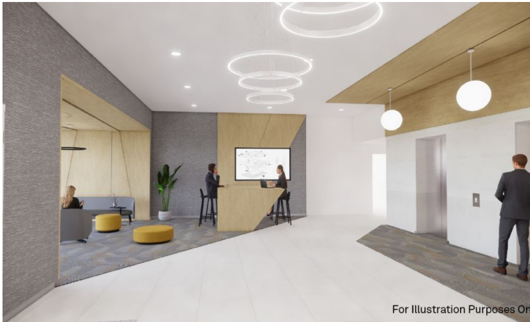
Aux fins d'illustration seulement - esquisse entré