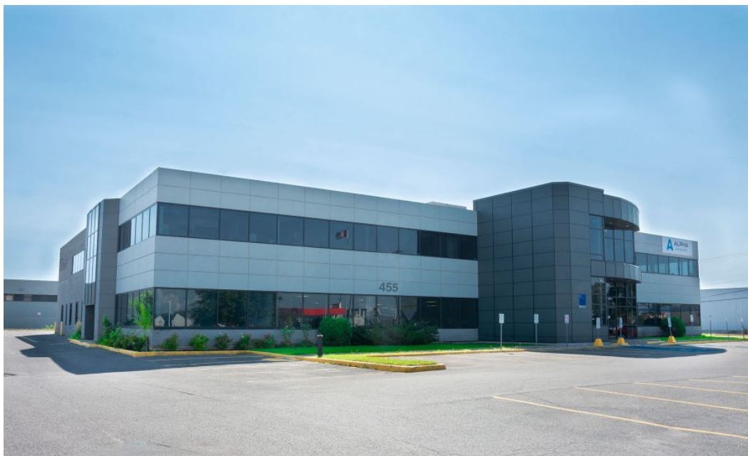
PHOTO DE L'IMMEUBLE