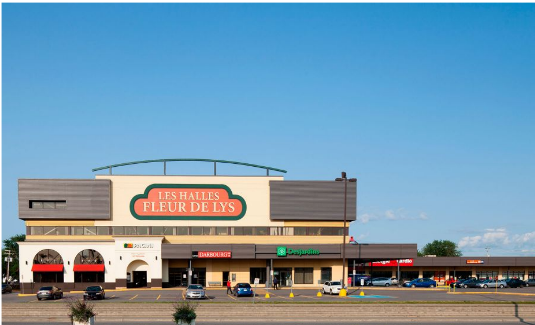
PHOTO DE L'IMMEUBLE