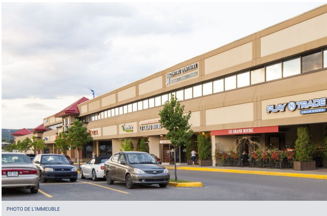
PHOTO DE L'IMMEUBLE